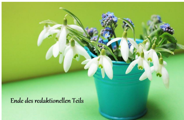
Ende des redaktionellen Teils

Wir sind die Interessenvertretung für die Immobilieneigentümer, WEG-Eigentümer, Vermieter, Kauf- und Bauwillige seit über 100 Jahren.