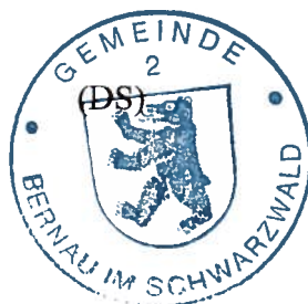
Alexander Schönemann Bürgermeister

Bernau im Schwarzwald, den 08. November 2018